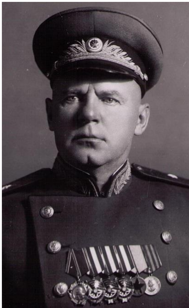
Генерал-майор Семен Иванович Недви́гин

последствии суждено будет в числе первых советских военачальников удостоиться воинского звания генерал-майора.