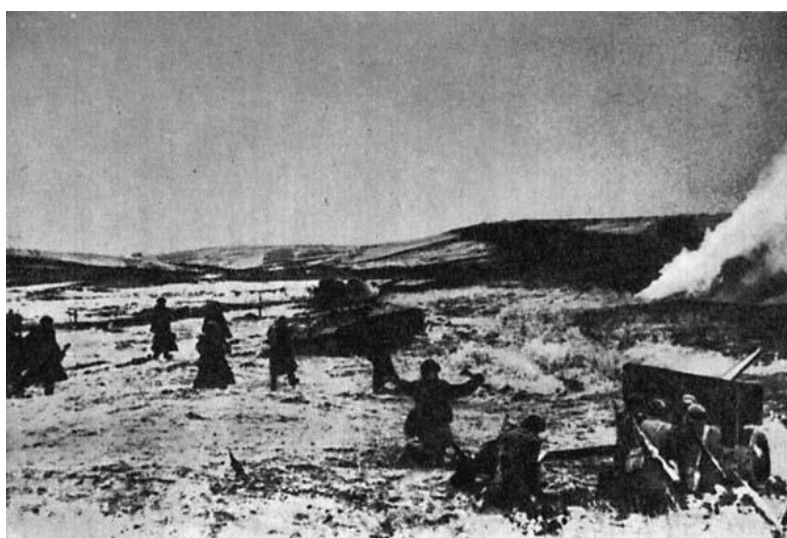
Бой в Карпатах.

Действия советских и чехословацких войск были усложнены как природными условиями этих мест, так и созданными здесь — сильно укрепленными позициями противника, имевшего большой опыт ведения боевых действий в горах. Корпус генерала Веденина прорвал оборонительный рубеж противника силами одной 242-й горно-стрелковой Таманской краснознаменной ордена Кутузова II степени дивизии под командованием генерал-майора В. Б. Лисинова, усилив ее гвардейскими артиллерийским и минометным полками. Другие части были введены в прорыв позже. Войска умело обходили узлы сопротивления и, проникая в тыл противника, находили в его обороне уязвимые места. Сражались с огромным мужеством. Андрей Яковлевич гордился своими бойцами и командирами, совершавшими чудеса храбрости. Ему приятно было доложить командующему фронтом о том, что утром 20 сентября 1944 г. первым из советских частей вступил на землю Чехословакии 1-й стрелковый батальон 897-го горнострелкового Севастопольского полка, а к 12 часам дня государственную границу перешел весь корпус. Позже А.Я.Веденину была оказана высокая честь стать почетным гражданином Кали-нова — первого словацкого населенного пункта, освобожденного его соединением.