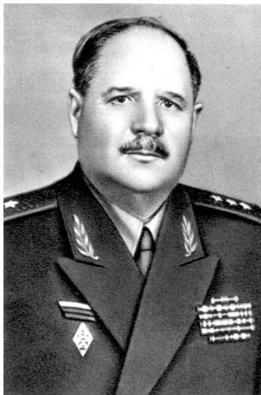
Генерал-полковник Иван Васильевич Болдин