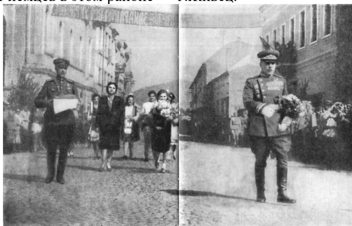
Встреча дивизии 3-го горнострелкового корпуса в освобожденном городе.