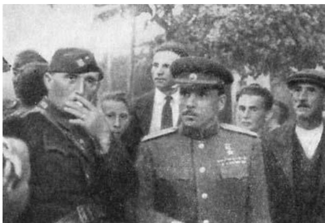
Встреча с жителями Оломоуце.

Уже было водружено Знамя Победы над поверженным рейхстагом, а на чехословацкой земле продолжались бои, гибли люди. Командующий группировкой немецких войск в Чехословакии генерал-фельдмаршал Франц Шерер—«кровавый Франц», как называли Шерера в его собственных войсках,— отказался капитулировать.