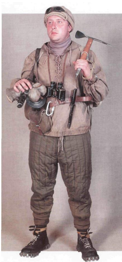
Стрелок-автоматчик, горнострелковые части, 1942—43 гг.

В годы гражданской войны в Средней Азии красный командир приобрел опыт ведения боев в горных условиях. И вот теперь, в 1944-м, ему было приказано возглавить 3-й горнострелковый корпус. Весной и летом это соединение участвовало в разгроме вражеских войск на Северном Кавказе и в Крыму, а в конце августа в срочном порядке оно было передислоцировано во Львовскую область и вошло в состав 4-го Украинского фронта. Встреча с командующим фронтом генерал-полковником Иваном Ефимовичем Петровым была радостной: ведь когда-то они вместе воевали против басмачей в Средней Азии. Теперь им предстояло участвовать в освобождении от фашистов Чехословакии.