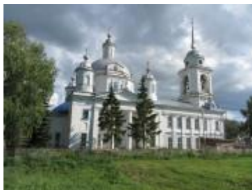
Вознесенская церковь В с. Семеновское