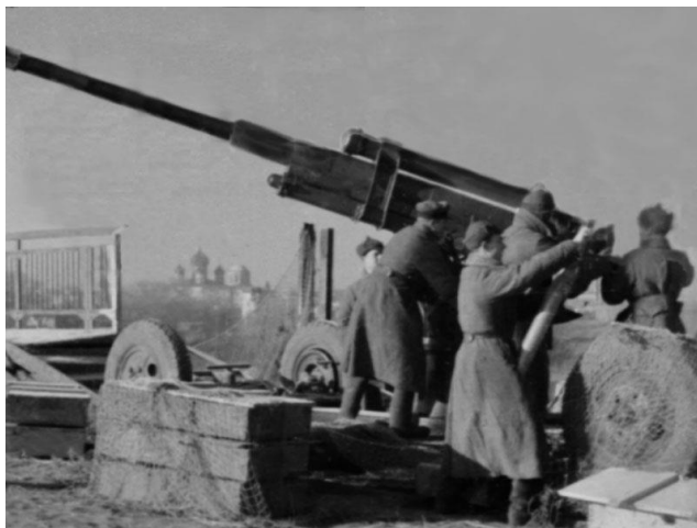
Оборона Тулы. Осень 1941 г.