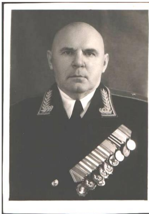
Генерал-лейтенант Андрей Яковлевич Веденин.