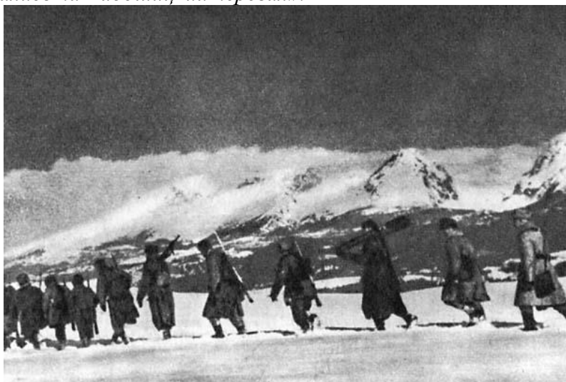
«Через горные перевалы»

«Мы должны были прорвать оборону немцев в направлении Буковица — Ясель — Габуров. Предварительно надо было преодолеть горный хребет, так называемые Восточные Бескиды... Войска 1-й гвардейской армии под командованием генерал-полковника А.А.Гречко, и в частности, наш корпус, нацеливались на Радошицкий перевал».