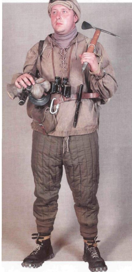
Стрелок-автоматчик, горнострелковые части, 1942—43 гг.

В годы гражданской войны в Средней Азии красный командир приобрел опыт ведения боев в горных условиях. И вот теперь, в 1944-м, ему было приказано возглавить 3-й горнострелковый корпус. Весной и летом это соединение участвовало в разгроме вражеских войск на Северном Кавказе и в Крыму, а в конце августа в срочном порядке оно было передислоцировано во Львовскую область и вошло в состав 4-го Украинского фронта. Встреча с командующим фронтом генерал-полковником Иваном Ефимовичем Петровым была радостной: ведь когда-то они вместе воевали против басмачей в Средней Азии. Теперь им предстояло участвовать в освобождении от фашистов Чехословакии.