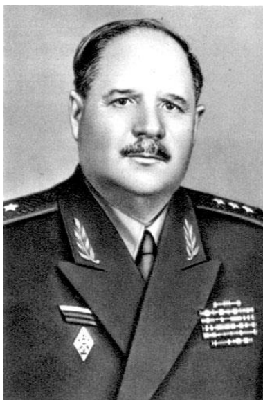
Генерал-полковник Иван Васильевич Болдин