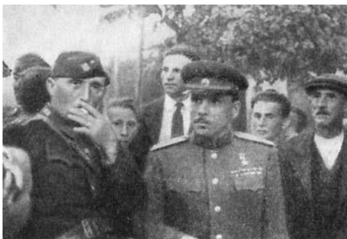
Встреча с жителями Оломоуце.

Уже было водружено Знамя Победы над поверженным рейхстагом, а на чехословацкой земле продолжались бои, гибли люди. Командующий группировкой немецких войск в Чехословакии генерал-фельдмаршал Франц Шерер—«кровавый Франц», как называли Шерера в его собственных войсках,— отказался капитулировать.