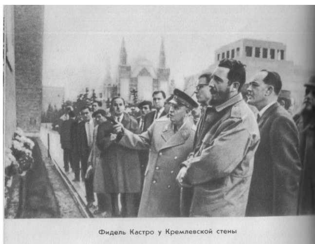
А. Я. Веденин показывает Московский Кремль лидеру Кубинской революции Фиделю Кастро.

День возвращения Советским правительством Румынии этой редчайшей коллекции стал настоящим праздником румынского народа.