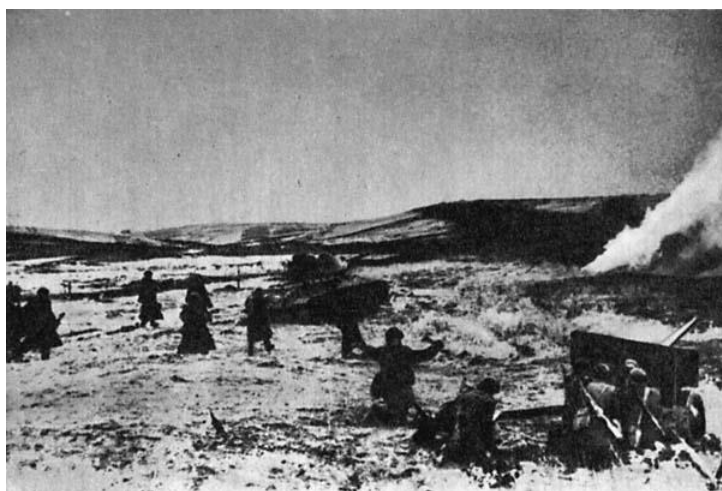
Бой в Карпатах.

Действия советских и чехословацких войск были усложнены как природными условиями этих мест, так и созданными здесь — сильно укрепленными позициями противника, имевшего большой опыт ведения боевых действий в горах. Корпус генерала Веденина прорвал оборонительный рубеж противника силами одной 242-й горно-стрелковой Таманской краснознаменной ордена Кутузова II степени дивизии под командованием генерал-майора В. Б. Лисинова, усилив ее гвардейскими артиллерийским и минометным полками. Другие части были введены в прорыв позже. Войска умело обходили узлы сопротивления и, проникая в тыл противника, находили в его обороне уязвимые места. Сражались с огромным мужеством. Андрей Яковлевич гордился своими бойцами и командирами, совершавшими чудеса храбрости. Ему приятно было доложить командующему фронтом о том, что утром 20 сентября 1944 г. первым из советских частей вступил на землю Чехословакии 1-й стрелковый батальон 897-го горнострелкового Севастопольского полка, а к 12 часам дня государственную границу перешел весь корпус. Позже А.Я.Веденину была оказана высокая честь стать почетным гражданином Кали-нова — первого словацкого населенного пункта, освобожденного его соединением.