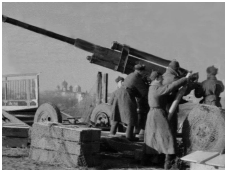
Оборона Тулы. Осень 1941 г.