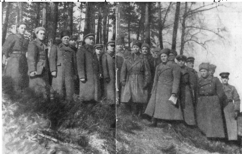
Группа генералов и офицеров 3-го горнострелкового корпуса на рекогносцировке.

был назван и 3-й горнострелковый корпус. Ему было присвоено почетное наименование — «Карпатский». В ознаменование этой победы столица нашей Родины Москва салютовала войскам 4-го Украинского фронта двадцатью артиллерийскими залпами из 224 орудий.