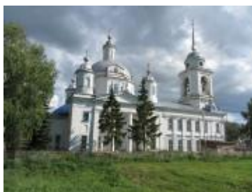
Вознесенская церковь в с. Семеновское

«Село Семеновское раскинулось на большом плато невысокого взгорья. От него во все стороны уходят в безбрежную даль поля и луга. Среди них то большими, то маленькими островками выделяются деревни и села, леса и сады. Блестит, серебрится река Меня... В селе свыше 600 домов и 4 «казенных» здания: волостное правление, начальная школа, «монополка» (винная лавка) и церковь. Село торговое, известное на всю округу. Длинные, вытянутые улицы назывались: Большая, Вытняя, Вакурная. На окраинах домишки маленькие, невзрачные — там ютилась крестьянская беднота. К центру, как бы набирая силу и представительность, высились окнистые дома, с тесовыми и даже железными крышами. Тут благоденствовала сельская знать: купцы Алатарцев и Денисов, кондитер Юдин, хозяин трактира Деулин, волостное начальство — староста, писарь и урядник...» 27 ноября 1900 г. в этом богатом и крепком русском селе Алатырского уезда Симбирской губернии в семье крестьянина Якова Осиповича Веденина родился сын Андрей.