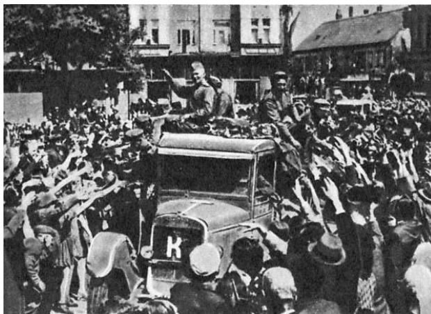
«Так встречала Прага»

3-й горнострелковый корпус, преодолев большие расстояния, приблизился к Оломоуцу — городу на реке Морава. Подступы к нему с востока прикрывались мощной системой огня и глубоким противотанковым рвом. В результате напряженных боев 4 мая Оломоуц был освобожден от врага. Войска корпуса, заслужившие за успешное проведение этой операции благодарность Верховного Главнокомандующего, продолжали сражаться и несли немалые потери. День Победы веденинцы отметили только 12 мая.