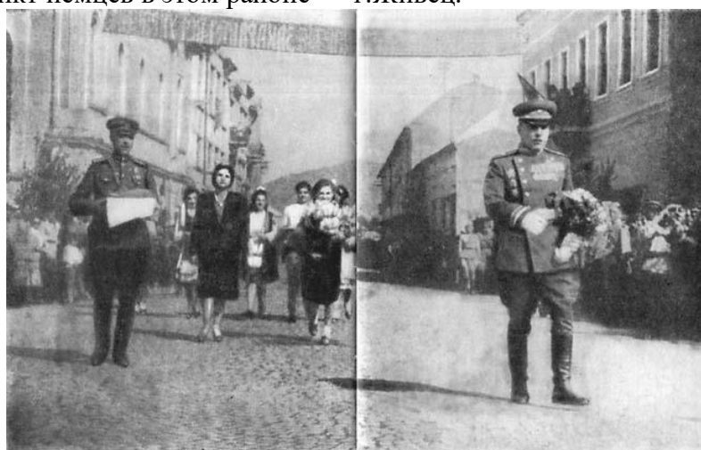
Встреча дивизии 3-го горнострелкового корпуса в освобожденном городе.